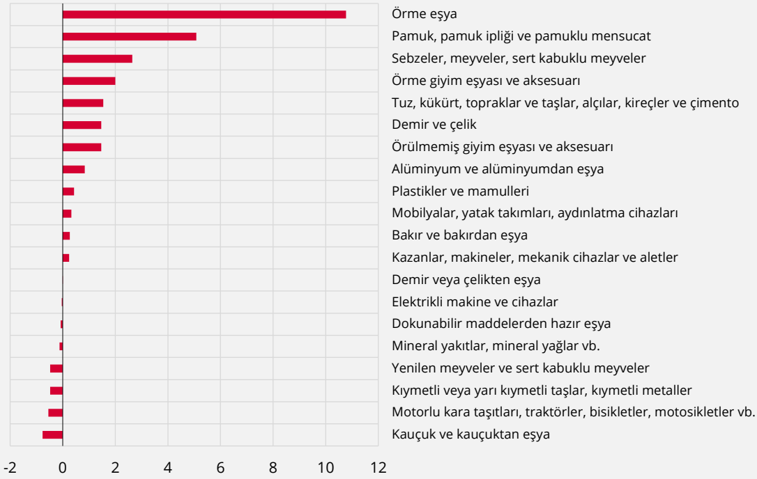
Grafik 2: 2021 İlk Çeyrekte İhracat Ana Ürün Grupları Pazar Payı Değişimleri (% Puan Fark, 2020 Yılı İlk Çeyreğe Göre)