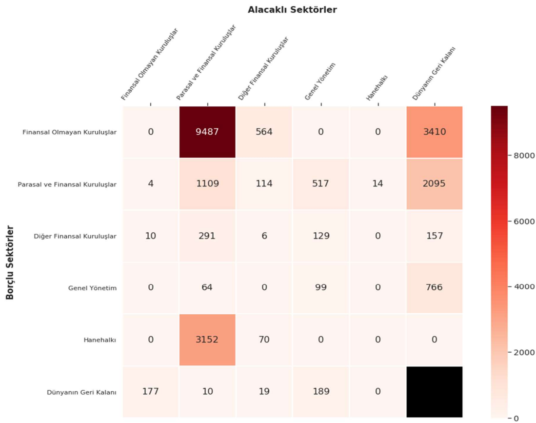
Grafik 28: Krediler, Kimden-Kime (Stok, Milyar TL)

Kredilerin kimden-kime matrisleri incelendiğinde, 2024 yılı birinci çeyreğinde en büyük bağlantının, finansal olmayan kuruluşlar ile parasal ve finansal kuruluşlar arasında gerçekleştiği görülmektedir. Parasal ve finansal kuruluşlar toplamda 14.112 milyar TL tutarında kredi kullanırken, kredilerin 9.487 milyar TL'lik kısmını finansal olmayan kuruluşlara ve 3.152 milyar TL'lik kısmını ise hanehalkına vermiştir. Yurt içi sektörler tarafından dünyanın geri kalanından 6.428 milyar TL'lik kredi kullanılmış, bunun 3.410 milyar TL'lik kısmını finansal olmayan kuruluşlar, 2.095 milyar TL'lik kısmını parasal ve finansal kuruluşlar, 766 Milyar TL'lik kısmı ise genel yönetim kullanmıştır (Grafik 28).